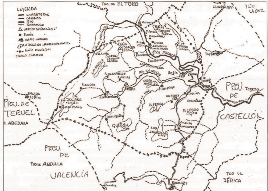
Mapa del Término con indicación de las fuentes.

Demasiado breve este recorrido ya que alrededor de cada una de las fuentes citadas se