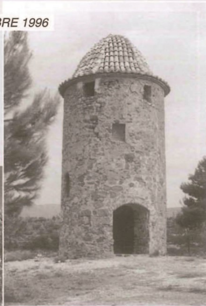
Torre del Molino