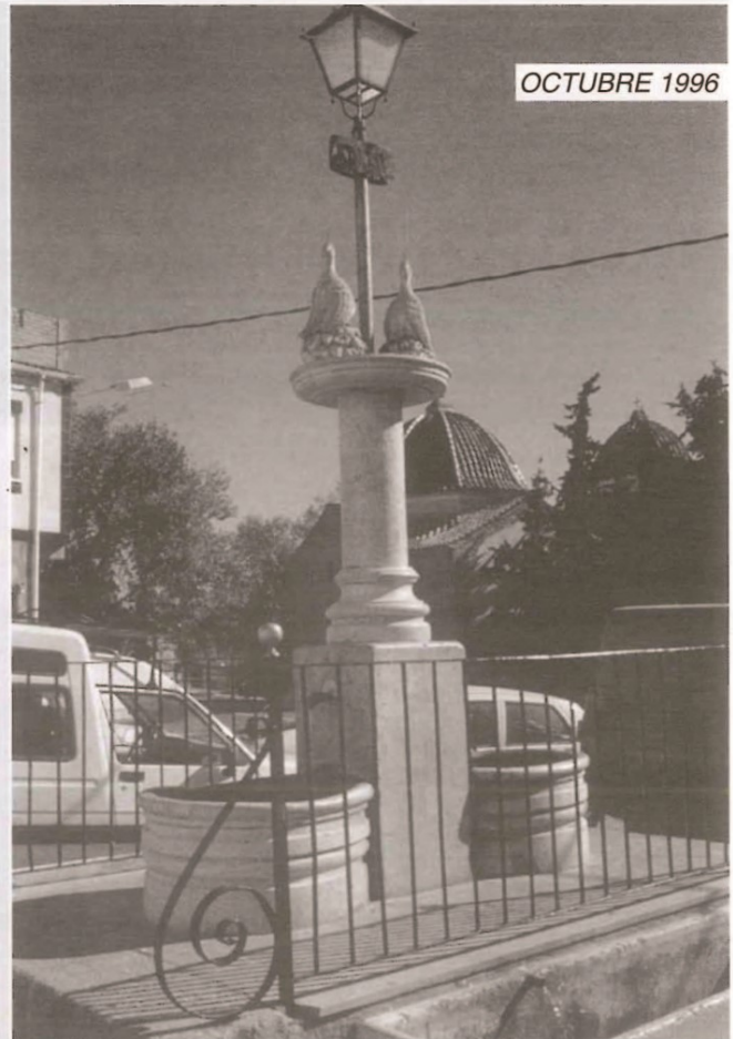
Fuente de los Patos.