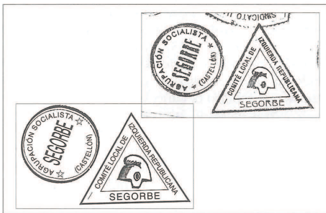
Sellos (Cuños), de Izquierda Republicana (IR) y Agrupación Socialista. Original y su reproducción-restauración.

Las referencias al periodo posterior al 18 de julio son realmente fragmentarias, no sirven para hacernos una idea de lo que pasó con el amplísimo patrimonio histórico-artístico de la ciudad de Segorbe. Esta carencia de materiales no