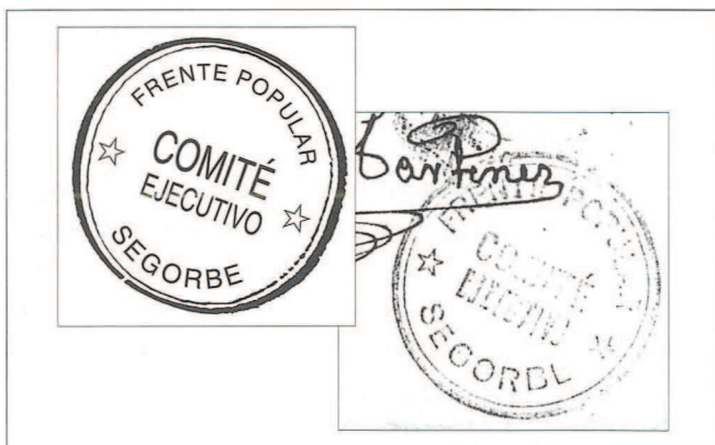
Sello (Cuño), del Comité Ejecutivo del Frente Popular, de Segorbe (CEFP). Original y su reproducción-restauración.

A las milicias que operaban en el frente y a la Columna de Hierro también se les pagaron las cenas, comidas y almuerzos que consumieron mientras permanecían en Segorbe; pero en ningún momento se les proporcionaron ni municiones ni material bélico de ninguna clase; éstas sólo se entregaron a las milicias de Segorbe: el 19 de agosto se firmaba un vale de 4 bolsas de municiones para "La Desesperada" (más adelante trataremos ampliamente el tema de estas milicias locales); el 9 del mismo mes el CEFP reconoce haber recibido "2350 pesetas para pago de municiones" (29) , no sabemos si para "La Desesperada" o con destino a las guardias/milicias de partidos y sindicatos locales (30) .