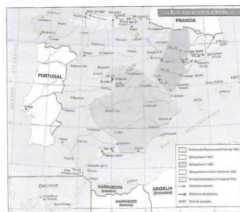
Mapa esquemático del Alzamiento de 1936.