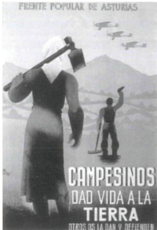
Cartel del Frente Popular.

Hemos de señalar, por lo insólito, que el día 17 de febrero los vigilantes de arbitrios de pesos y medidas y puestos públicos realizaron la única huelga de la que tenemos noticia durante toda la guerra en Segorbe 41 . ¿Cuales fueron los motivos?. Realmente se ignoran, pero podemos