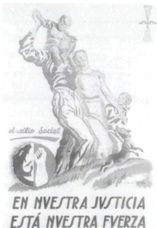
Cartel de Falange Española.

Las actividades de URN se centraron, fundamentalmente, en intentar evitar un ataque frontal a la legalidad republicana desde el ayuntamiento; colaboran en lo que hace falta, pero siempre dentro del más estricto respeto a las órdenes recibidas de la Superioridad. Buen ejemplo de esta actitud lo tenemos en su oposi-