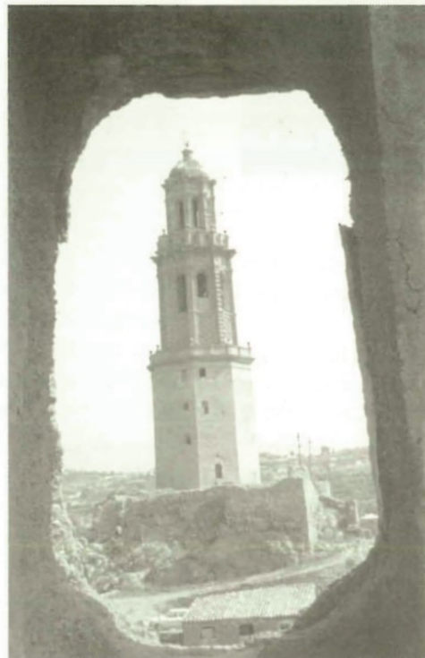
Vista general de la Torre-Campanario.

TERMINAR la RESTAURACION del interior de la TORRE DE LAS CAMPANAS, nos permitirá instalar una exposición permanente de caracter histórico y etnológico que nos acercará a ua mejor