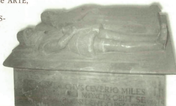
Monumento funerario de "los Valero". Museo Municipal.

EL CASCO URBANO HISTORICO DE JERICA nos merece mención aparte por su característica de CONJUNTO MONUMENTAL. Queremos concienciar a los vecinos de la importancia de