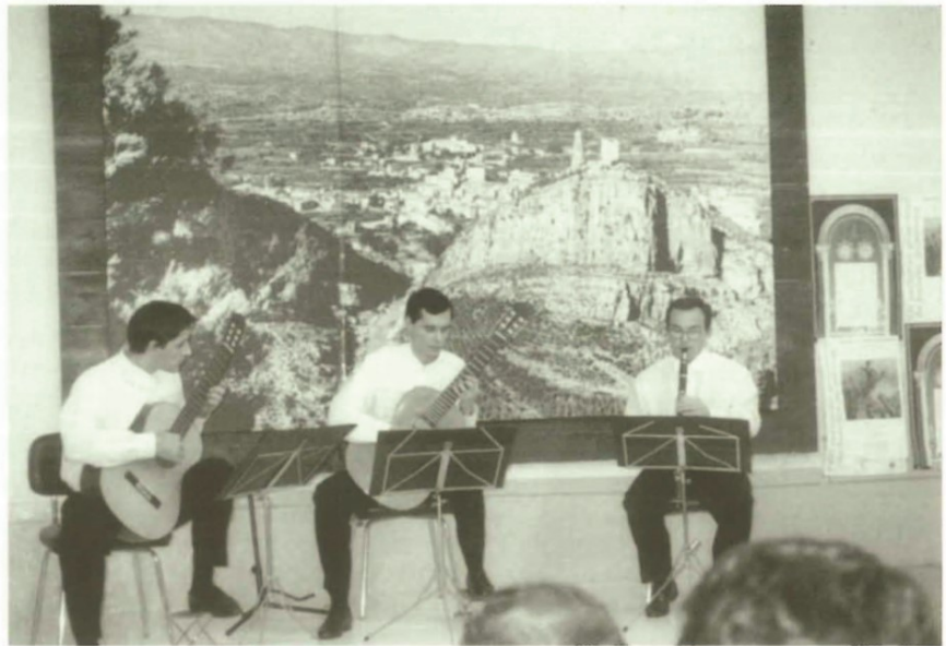
Conciertos. Actividad Cultural de Jérica.