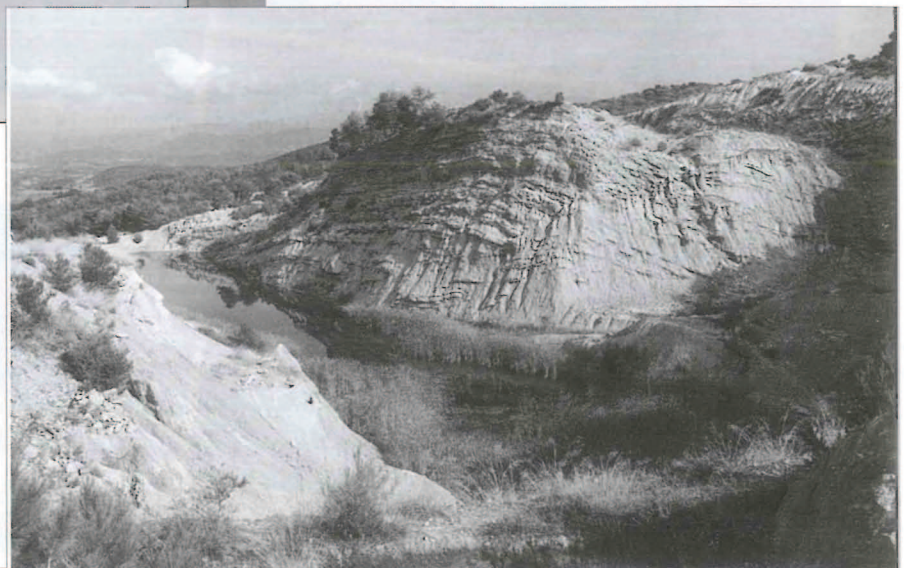
Lago redondo del Portillo.