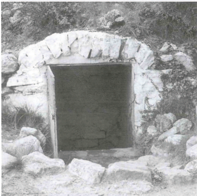
Navajo del "Agua Amarga" o "Sinainas"