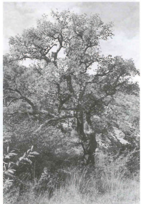
Ejemplar de alcornoque en la Jabonera