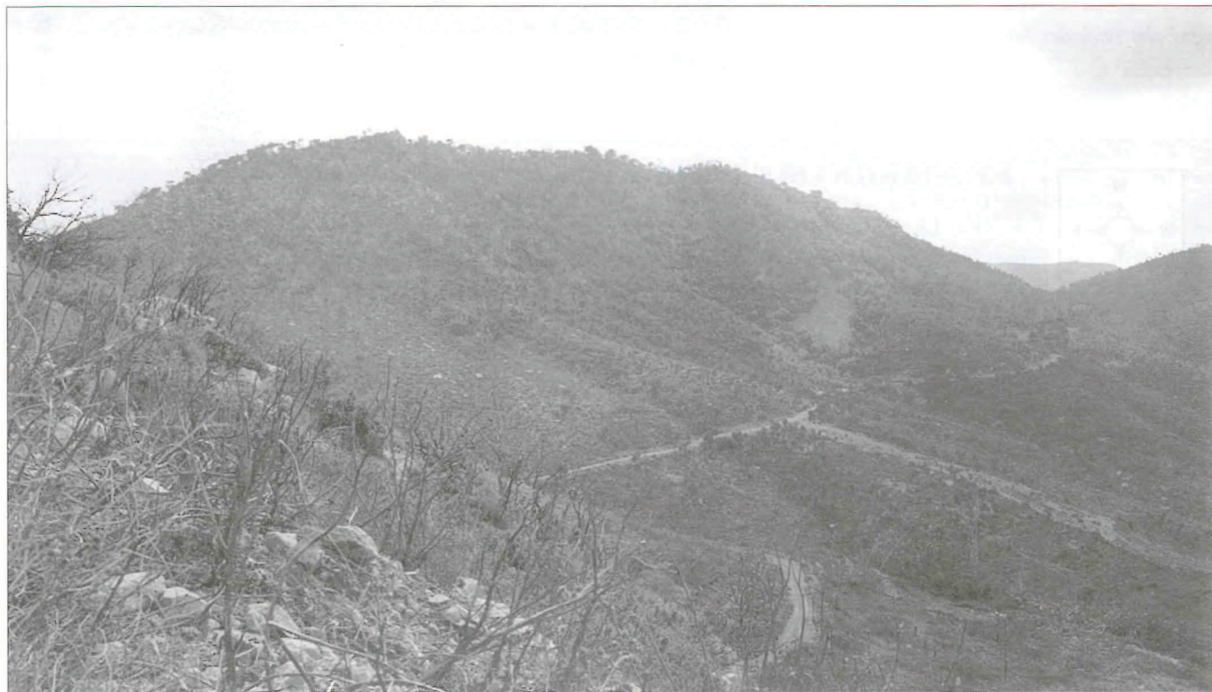
El Monte Mayor.

Proseguimos el camino para llegar a las faldas del monte conocido como la Jabonera en el que de manera excepcional se puede encontrar un importante bosque de alcornoques, único en la sierra Calderona. El camino discurre ahora en dirección SE para conducirnos a la masía de Tristán. El edificio y los terrenos que lo rodean son propiedad del ICONA, que ha restaurado la masía transformándola en albergue durante las épocas de vacaciones, cuando se instalan en ella colonias de escolares para pasar unos días en contacto con la Naturaleza.