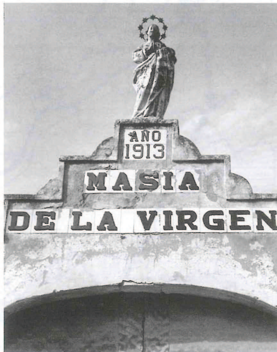
Imagen de la Virgen sobre la entrada principal de la masía del Gabacho.

Una vez en la masía podemos admirar un claro ejemplo de la arquitectura rural de la comarca. Ya abandonada como explotación agrícola, la masía de Ferrer conserva sus edificios de gran porte, con un