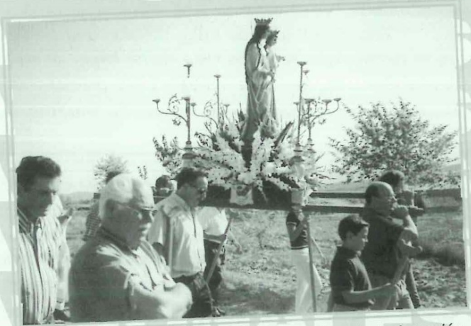
Fiestas Patronales. Festividad de Ntra. Sra. de la Asunción.