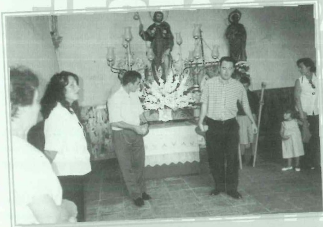
Fiestas Patronales de San Roque.