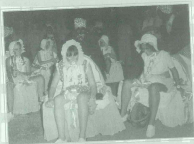
Fiestas Patronales. Baile de disfraces.