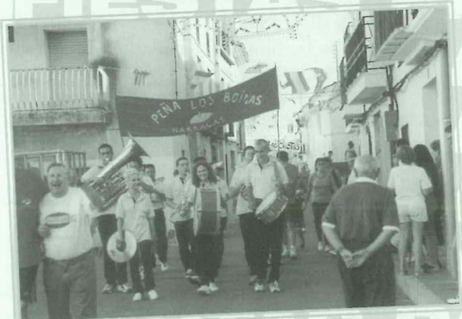
Fiestas Patronales. Pasacalle de Peñas.