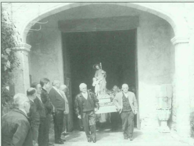
Procesión del día de S. José. Patrón de la Cooperativa de Consumo San José. Bóveda de la puerta de acceso a la Iglesia de S. Pedro Apóstol.

Ya han acabado las fiestas, y sólo me queda, animar al lector que si no las conoce, venga a visitarlas, y ya nunca podrá dejar de venir, pues recordemos que son de todos y para todos, os espero con ilusión los años que vienen.