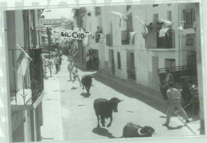
Fiestas Patronales. Entrada de vacas y toros.