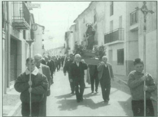
Procesión del día de S. José. Patrón de la Cooperativa de Consumo San José..