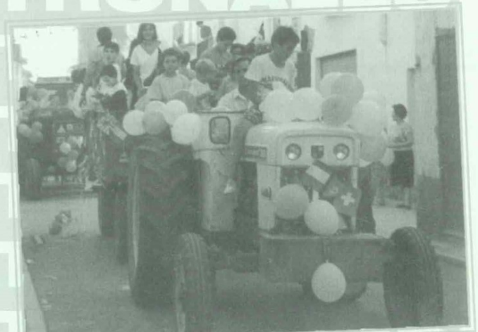
Fiestas Patronales. Cabalgata de disfraces.