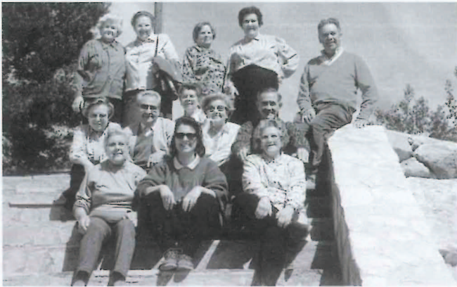
Grupo Centro 3.ª Edad. Graduado/Postgraduado y Educación de Base. (Curso 97-98).

vés de sus programas formativos, así como la incidencia de múltiples instituciones públicas y privadas están canalizando hacia la comarca numerosos y variados recursos y acciones.