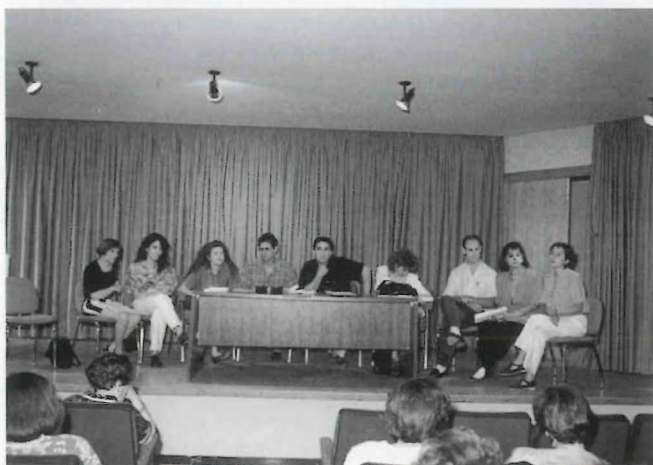
Equipo Profesores. Clausura Fin de Curso en Segorbe. (Curso 90-91)

Estructura local: CONSEJO DE LA FORMACION . Participan en él todos los agentes, instituciones e iniciativas de formación que desarrollan en una localidad.