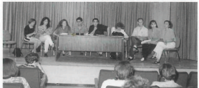
Equipode profesores clausura fin de curso, en Segorbe. (curso 90/91).

El aire, el agua y las gentes de estos sabrosos lugares, te está esperando.”