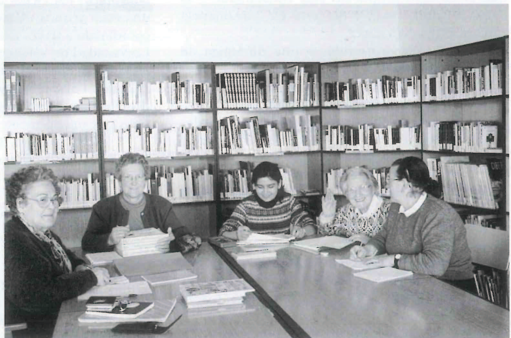
grupo de Educación de Adultos. Programa municipal Caudiel.

A pesar del marcado entusiasmo de alumnos y profesores, debemos poner de manifiesto que algunos de aquellos municipios pioneros han abandonado el programa. Estos diez últimos años han sido con todo años de ilusión y trabajo. Hemos intentado, en la medida de lo posible, dar respuesta a todas aquellas necesidades culturales y de formativas en el mundo de los adultos y con ello conseguir una mayor proyección personal y abrirse nuevos caminos como ciudadanos. Se espera que estas necesidades sigan en aumento y que crezca la demanda de conocimientos, relacionada con los transformaciones económicas, sociales y culturales; para lo cual se intentará dar respuesta con un incremento en las propuestas educativas y lograr que la Educación de Adultos sea una herramienta para el desarrollo y calidad de vida para todos.