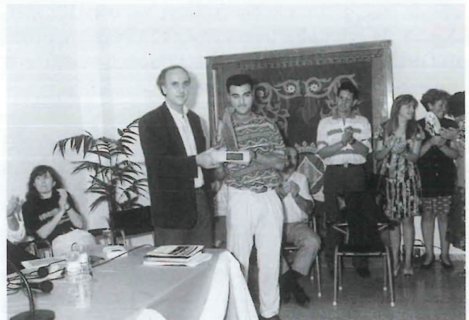
Final curso 93-94 en Soneja. Entrega del premio "Fundación Bancaja Segorbe".

En lo que se refiere al marco legislativo