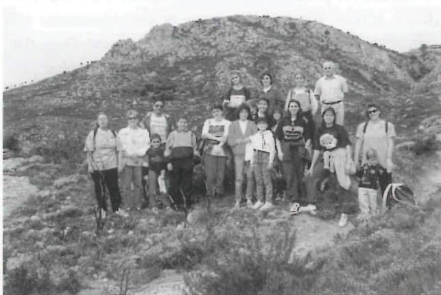
Itinerarios Culturales. Cueva Cerdaña. (97/98).

De esta manera, poco a poco, con altibajos obligados, con la incorporación sucesiva de nuevos "medios humanos" y nuevos recursos, fue asentándose y tomando cuerpo un proyecto que hoy, diez años después de aquellos "pioneros" inicios, se ha convertido en elemento indispensable, en punto de referencia incuestionado de la actividad cultural de nuestros pueblos y en plataforma de formación de un elevado número de gentes que, desde las tareas formativas o simplemente participativas, componen el grueso de la vida cultural de nuestra comarca.