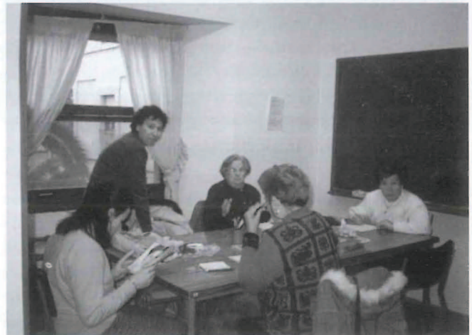
Actividades en el aula Grupo E. Base. (Curso 97-98).

Mayores de 45. Sector con graves dificultades de adaptación al nuevo mercado de trabajo.