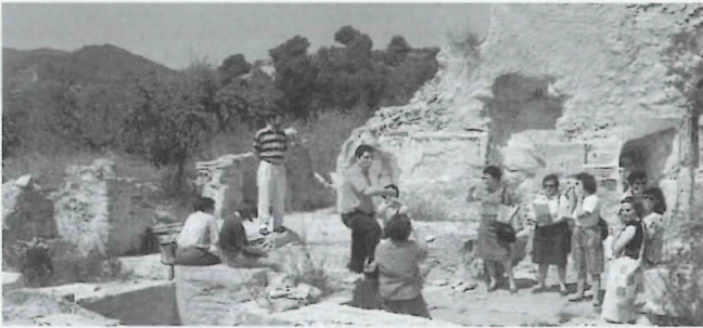
Visita de alumnos de graduado a la Cartuja de Vall de Cristo. (curso 87/88).

población la posibilidad de “descubrir” espacios, de “conocer,” lugares y paisajes, yacimientos arqueológicos, monumentos, ....., que por una u otra causa habían permanecido ocultos para una masa importante de los habitantes de la comarca. El objetivo básico era, pues, compaginar la historia y la cultura, aunar la visión y el estudio de lugares de cierta relevancia histórica con la visita a espacios naturales interesantes por su valor intrínseco, por su preservación natural o su belleza paisajística. Como señalaba E. Valdeolivias en una ocasión, nuestro destino era “... una fuente, una vereda, un valle escondido, unas crestas desafiantes coronadas por un castillo ruinoso, una cavidad con su oscuro misterio, (...) disfrutando de lo que todavía resiste al abuso indiscriminado y haciendo votos para que pueda resistir mucho más”. Desde aquí procurábamos concienciar a nuestros ocasionales acompañantes sobre la necesidad de conservar para el futuro el arte y el paisaje, la obra humana de siglos anteriores y la misma obra de la naturaleza.