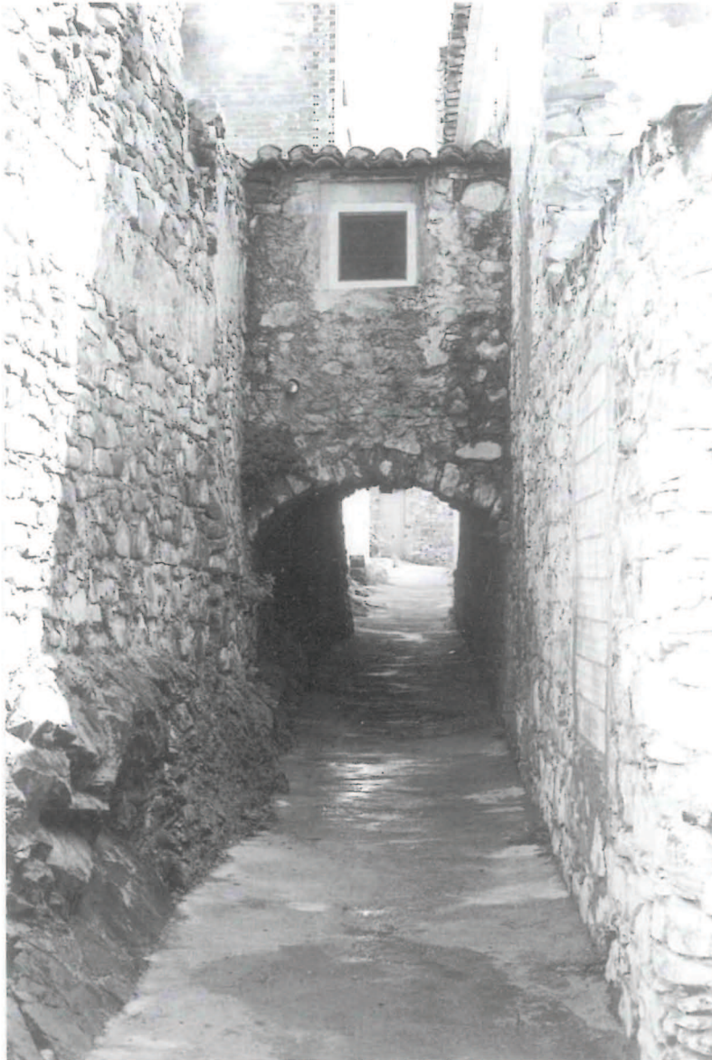
Callejear por Chóvar es descubrir sus fantásticos rincones.

En cuanto a las armas contenidas, en los cuatro cuarteles son las siguientes: