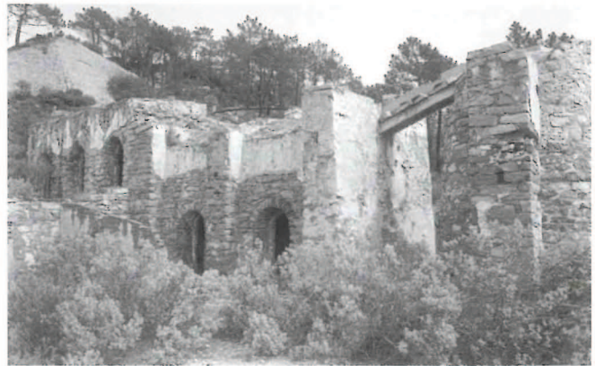
Hornos para la obtención del mercurio, vestigios de una actividad minera.

"...dos aldeas de los caballeros Ferragudes, que son Jova y Bellot, habitadas de algunas casas de moriscos; en cuyo campo antiguamente se descubrían mineros, y nos quedan aun los vestigios".