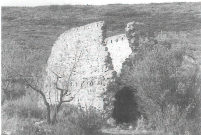
"La Torreta", adosada a la torre medieval, una cisterna de planta rectangular y bóveda., probablemente unica en la Comarca.