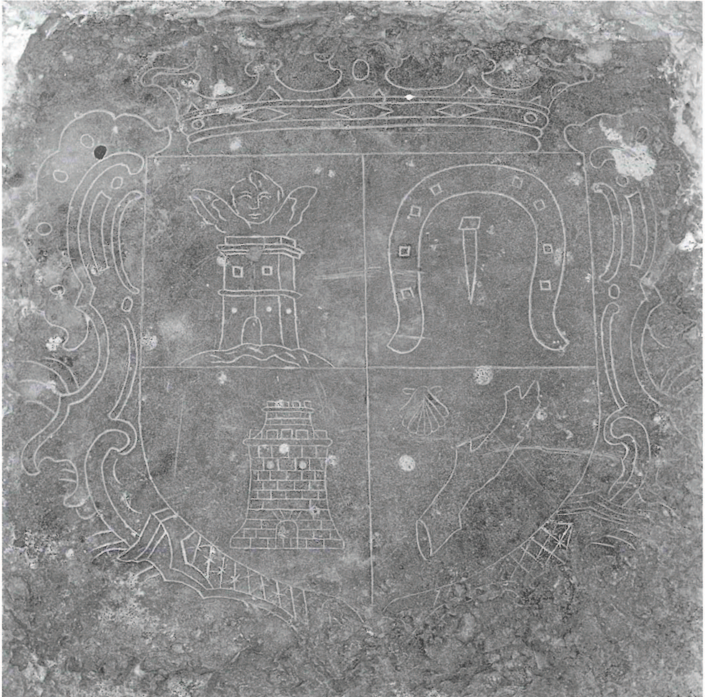
Un Escudo Heráldico de Chóvar.