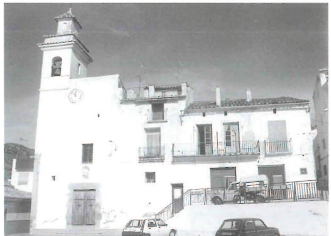
La Iglesia de Chóvar, al lado la llamada "Casa de la Señora".