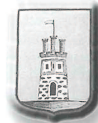
-Fotografías de José Martí.