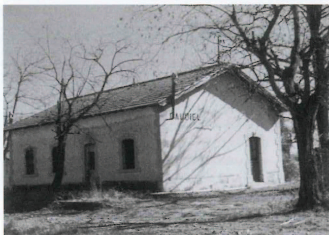
Caudiel. Estado de la Estación Minera.

Otras obras menores, y no menos importantes y necesarias, fueron un buen número de sifones, canalizaciones de agua, alcantarillas, tajeas, pequeños y medianos puentes, terraplenes, trincheras, etc. Todas las construcciones, grandes y pequeñas, se caracterizaron por el exquisito trabajo de mampostería y sillería, los cuales, camino de los cien años, se conservan en un magnífico estado.