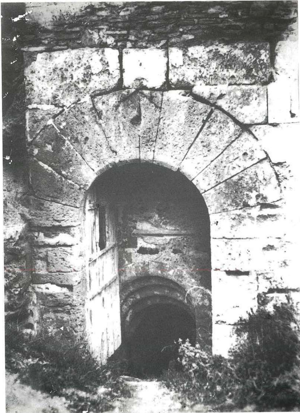
Portada de acceso al subterráneo de San Martín, actualmente muy deteriorada (Foto Archivo del Ayuntamiento de Altura, de hacia 1950)