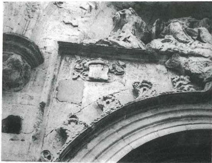
Pormenor de la portada de la Iglesia principal, con elementos escultóricos, relieves ornamentales y escudos