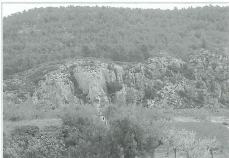
Vista general del yacimiento.

La pasta es heterogénea y grosera, los desgrasantes son abundantes y de diferentes tamaños, granos finos y medios. Los más gruesos son