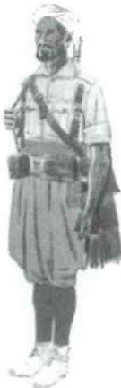
Soldado Tabor de Regulares