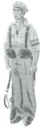
Carabiniere en Campaña