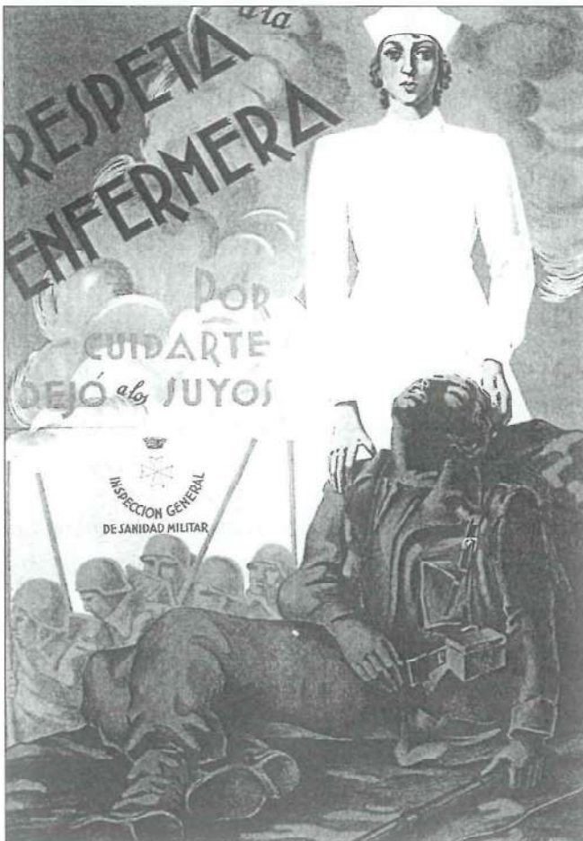
Ejército de la República. Típico cartel de hospital, en el que se enfatiza el respeto hacia la mujer.