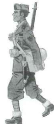
Soldado de la División Littorio