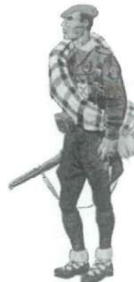
Soldado 5ª División Navarra