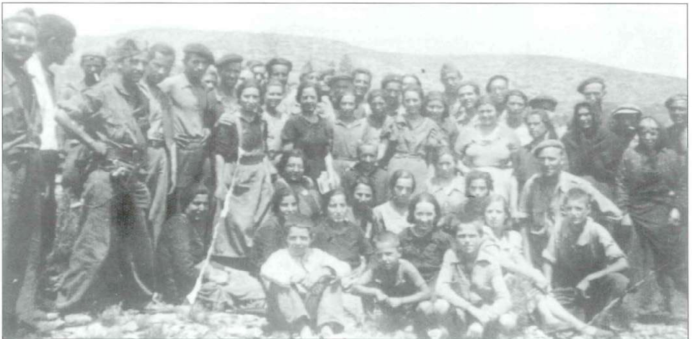
Refugiados en la Cueva de Fuente la Higuera, fotografiados en el Alto Moliner. Los soldados que aparecen son republicanos que se pasaron al bando franquista.

C.T.V. Cuerpo de Tropas Voluntarias Italianas.- Al mando del General italiano Mario