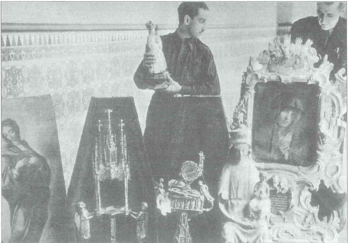
Un Falangista, del Servicio de Recuperación Artística, sostiene en sus manos la imagen de la Virgen del Colmillo.

homenaje en varias ocasiones, especialmente el 9 de septiembre de 1.939, día en que llegaron sus restos mortales desde Navajas, Segorbe y Villarreal, para recibir sepultura. Los que murieron en el frente, nadie, absolutamente nadie se acordó de ellos, salvo sus seres queridos. En el Archivo del Ayuntamiento no se ha encontrado ni un solo documento que dedique un recuerdo o una nota de dolor. Si he querido descubrir quienes murieron en los campos de batalla he tenido que entrevistar a las personas mayores que en su día los conocieron, fueron sus amigos, primos, hermanos, hijos, nietos, etc. He estrujado una y otra vez sus memorias para conocer sus nombres, fecha y frente donde murieron, en una desagradable labor en la cual, muchos han recordado a sus seres queridos con lágrimas en los ojos.