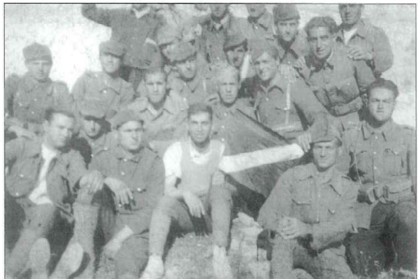
Frente de Extremadura. Soldados de la 114ª Brigada Mixta, con el Guión de la 1ª Compañía del 2º Batallón. Algunos de ellos son de Caudiel.

En el otro extremo, el Destacamento de Enlace, desde Onda, avanzaría con dirección Segorbe, Liria, Llombay, Alcira y Sueca, pero el avance fue frenado en la Sierra de Espadán, quedando una línea no rebasada que va desde los Altos del Pinar al vértice Espadán, y desde Ahín a Eslida. Desde el S-E de la provincia de Castellón, el Cuerpo de Ejército de Galicia avanzaría con una División por la franja litoral con dirección Sagunto-Valencia hasta alcanzar la línea Grao de Valencia, Alboraya y Burjasot. El resto de fuerzas seguiría la dirección Segart, Betera, Paterna, Torrente y Catarroja, envolviendo de esta manera la capital del Turia así como su feraz y fértil huerta. El avance no superó la línea Castillo de Castro, Ermita de los Santos de la Piedra (Al Norte de Vall de Uxó) y Nules.