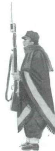
Miliciano en Campaña