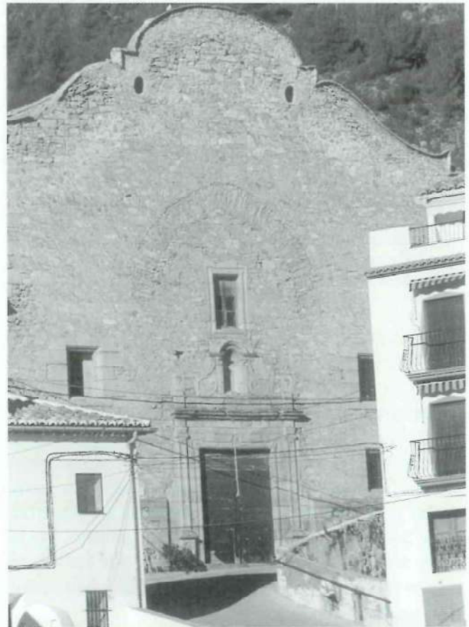
Portada de la iglesia del ex-convento en 1996.