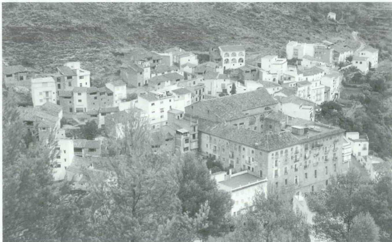
Vista del ex-convento en 1994 antes de la restauración del tejado de la iglesia y donde podemos ver el uso que tienen desde la desamortización las diversas dependencias de los frailes. Autor: J.B. CONEJERO.

A esto se ha de añadir la dispersión de aquellos objetos del convento que se llevaron con ellos los religiosos a otras parroquias o aquellos otros subastados públicamente. Por todas estas cosas hoy desconocemos dónde estarán aquellas posesiones del convento de Montán.