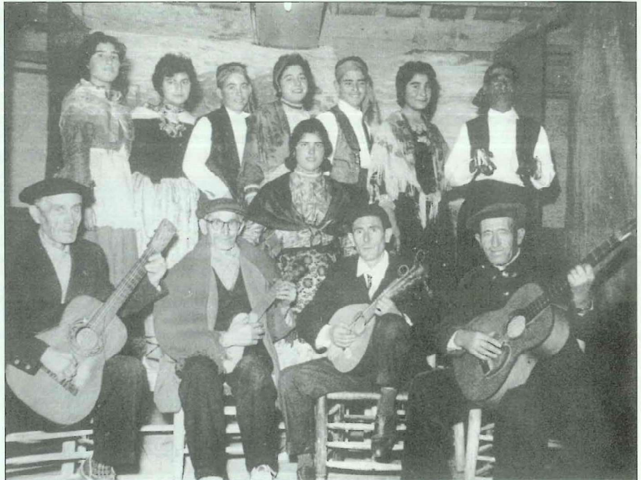
Grupo de Jotas de Geldo. Años '60.

Santo Cristo de la Luz, Que dicha que tiene Geldo; Todo el que entra en tu capilla Siempre sale con consuelo.