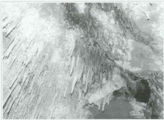
Foto 4. Bosques de estalagtitas de diferentes coloraciones en función de los materiales atravesados por el agua en su descenso, en su fluir por las diaclasas abiertas. Sima de la Toba.

En un contexto paisajístico y geomorfológico diferente se sitúa otra de las grandes joyas subterráneas del Alto Palancia, la cueva de la Toba . Para acceder a la cueva de la Toba, se parte de la población de Caudiel, tomamos la carretera en dirección a Montanejos y el desvío hacia Higuera, al cabo de unos kilómetros se debe tomar una pista a la izquierda en dirección a la fuente de la higuera, una vez en esa fuente, a unos 200 metros a la izquierda, se encuentra la sima.