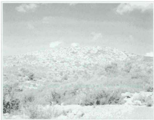
Foto 1. Afloración caliza formada por potentes bancos en Vall de Almonacid.

La formación y ensanchamiento de estas grietas, que dan origen a cuevas y simas con el tiempo, es achacable a la disolución del carbonato de calcio por ácidos. El agua de lluvia es ligeramente ácida, con un pH de 5,6, esto es debido al \text{CO}_2 , óxido de carbono (IV) o dióxido de carbono, éste es el gas traza más abundante en la atmósfera, con una concentración natural media de unas 340 partes por millón (ppm). Este gas se combina con el agua de lluvia para formar el \text{H}_2\text{CO}_3 , ácido tnoxocarbónico (IV) o ácido carbónico.