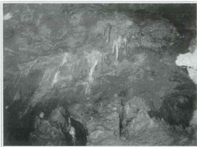
Foto 10 Estalactitas azules en la Cueva del toro.

Es una clásica cueva activa, con un claro dominio de niveles freáticos y epifreáticos, existiendo en su red principal un relativamente escaso porcentaje de galerías abandonadas por la circulación forzada horizontal. A este respecto, la red transitable es joven, como lo atestiguan los hasta tres sifones que se encuentran en su curso, estos tres sifones son de fácil paso, incluso sin botellas de oxígeno, salvo el último que plantea más dificultades, a pesar de ser, sin duda, perfectamente factible su paso a pulmón. Mención especial merecen unas estalagtitas que se presentan en grupos en diversos puntos y que ofrecen un color azul intenso, la razón de este color hay que buscarla en la presencia de iones metálicos coloreados en las rocas superiores a través de las cuales se desarrollan las diaclasas que permiten la formación de estas estalagtitas, la circulación vadosa a través de estas diaclasas arrastra por disolución estos iones metálicos que precipitan al formarse la estalagtitita, proporcionando en mencionado color azul.