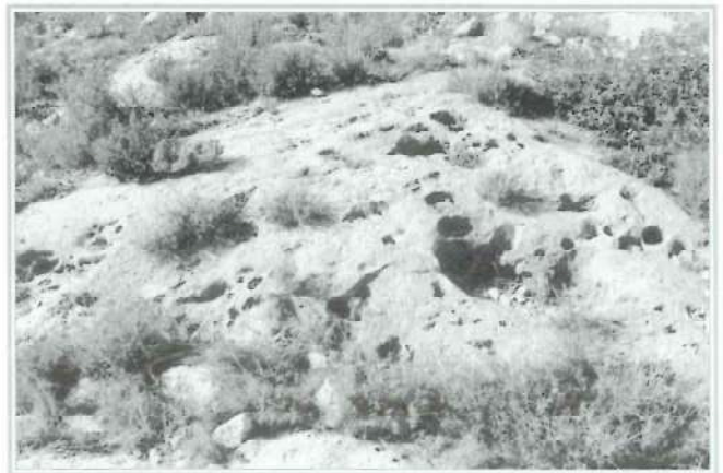
Foto 2. Formación de karst en roca caliza por disolución diferencial del carbonato de calcio. Vall de Almonacid.

En la naturaleza, esta disolución se realiza a favor de planos de disyunción, formándose las grietas o diaclasas, una vez formadas estas grietas, el proceso de karstificación sigue adelante perforando el macizo calcáreo, alcanzando en muchos casos considerables profundidades, hasta llegar a zonas sin posibilidad de karstificación, generalmente rocas arcillosas impermeables.