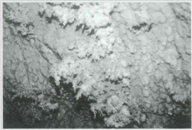
Foto 8. Concreciones calcáreas en forma de estrella denominadas "rosas". Sala de las rosas, cueva de Cirá.

Las galerías centrales son clásicos túneles fósiles, antiguos niveles freáticos, formados por circulación horizontal forzada de cursos de agua, ríos subterráneos que modularon estas galerías, con el transcurso del tiempo y el avance del proceso kárstico, estas galerías se convirtieron en vadosas, galerías sin circulación horizontal, que pasó a niveles inferiores. La única circulación sería de tipo vertical, por infiltración de agua por el techo, lo cual condicionó la aparición de las formaciones calcáreas que se pueden apreciar a lo largo de todas estas galerías, desafortunadamente, el expolio humano ha desprovisto de buena parte de estas formaciones a estas galerías, particularmente las más cercanas a la boca de entrada y, por tanto, las más accesibles. Con todo podemos encontrar una amplísima variedad de estalagmitas, estalagmitas, coladas, banderas, columnas, etc. Característicos de esta cueva son los gours, formaciones calizas en el suelo que asemejan pequeñas presas, se forman por la evaporación del agua superficial en charcos sobre la roca caliza, al evaporar, se deposita carbonato de calcio en los bordes con lo que se va formando la presa, la profundidad de charco va aumentando, y consecuentemente, sucesivos procesos de evaporación elevan la altura de las paredes de la presa, con lo que estos gours pueden alcanzar proporciones considerables.