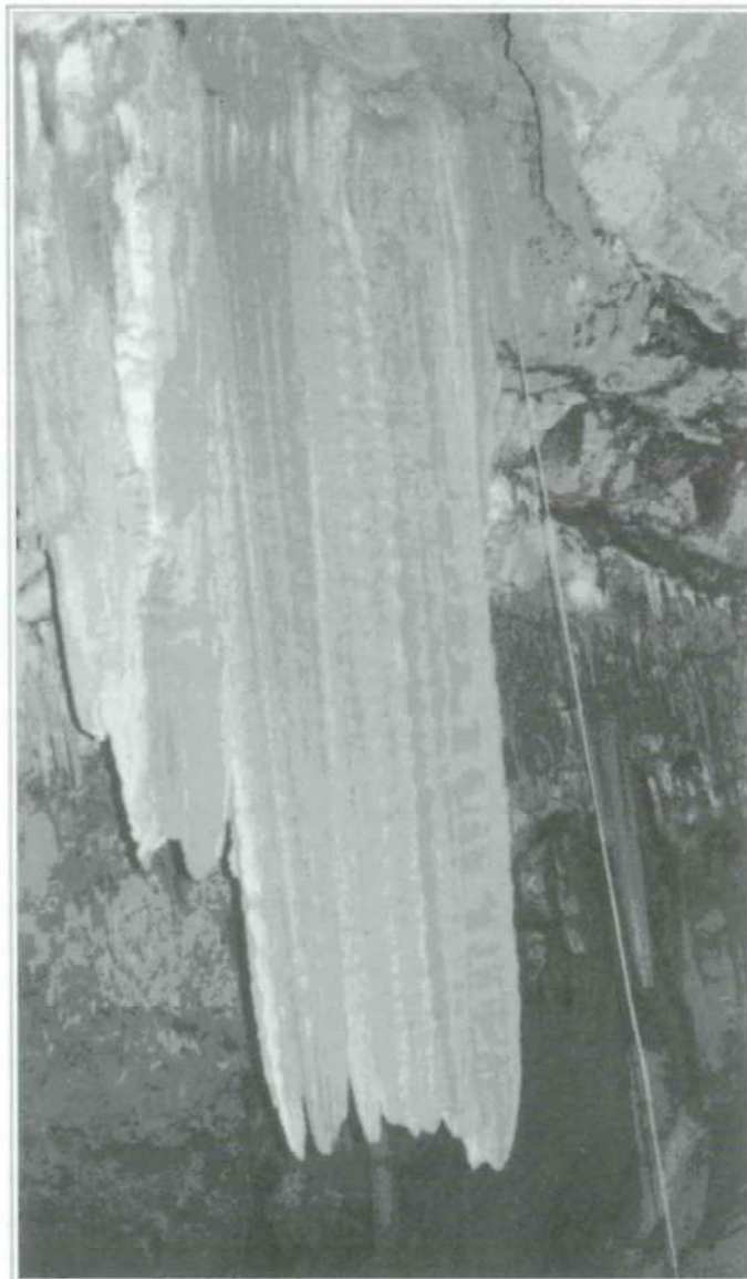
Foto 3. Pozo de bajada en la cueva del Estuco, con panorámica de la espectacular estalactita que lo acompaña. Algimia de Almonacid.

La cueva del Estuco consiste en una bóveda de considerables dimensiones, formada por procesos clásicos de hundimiento que se