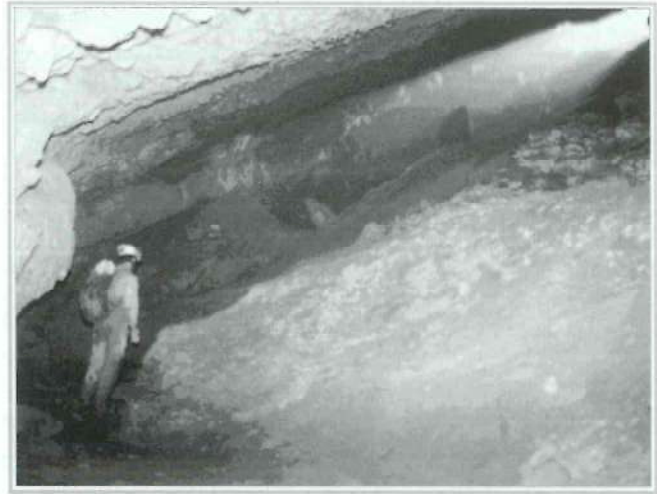
Foto 11. Espectacular laminador en la entrada de la Cueva de la covatilla.

Otra espectacular cueva activa es la cueva de la Covatilla, en la localidad de Ahín. Para acceder a ella, desde el pueblo, se baja andando al río, cruzándolo hasta la otra orilla, se desciende hasta encontrar una pista forestal amplia, que remonta por campos de cultivo, hasta la boca de la cueva.