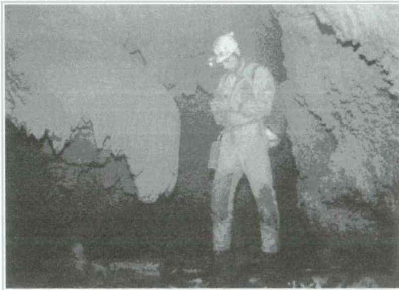
Foto 12. Río subterráneo. Cueva de la covatilla.

La conservación de estos espacios, es vital para preservar nuestro patrimonio natural, a pesar de lo que pudiera derivarse de una primera impresión son sistemas frágiles, muy vulnerables a la acción del hombre, probablemente un paso previo a la conservación es el conocimiento, y esta era la función de este artículo, una introducción a este mundo tan fantástico como, y seguramente, desconocido.