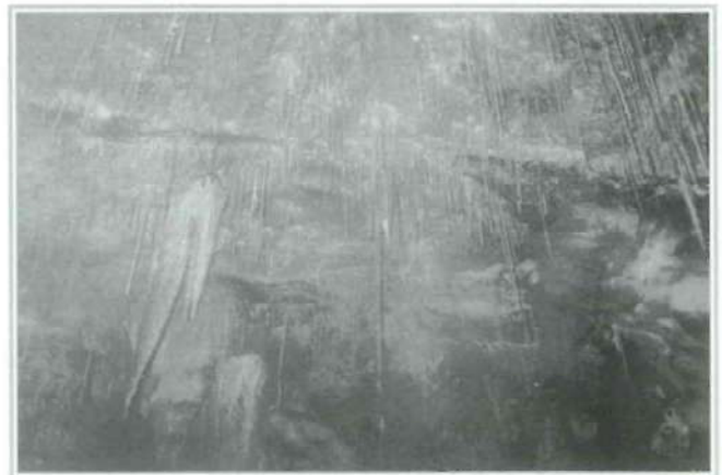
Foto 9 Estalagmitas en la bóveda de la cueva del Toro.

Desde la población de Alcedia de Veo, se toma la carretera en dirección a Almedijar, a la izquierda de la misma se encuentra el barranco de la Chelva, en su margen derecho se abre la boca de la cueva, fácilmente localizable pues de ella parte una acequia que canaliza el agua que surge de la misma.