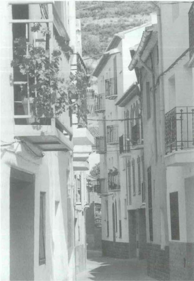
Calle del Rosario.

zarzas... se extiende como una selva que custodia el agua que corre entre las piedras.