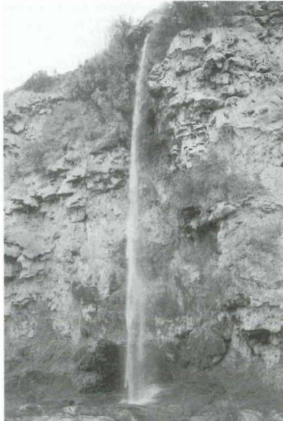
Cascada del Brazal.

Resulta fácilmente constatable que, con el correr de los tiempos, las costumbres cambian y, buena prueba de ello lo constituye la famosa frase de Cicerón pronunciada hace más de 2000 años: "O tempora, o mores!", es decir: "¡Oh tiempos, oh costumbres!", que nos confirma el hecho de que ya entonces se daban cuenta del emparejamiento existente entre los avances progresistas y las enormes evoluciones costumbristas. También está muy claro que, con ese devenir de los años, lo que en tiempos pretéritos parecían auténticas perversidades o modas demoníacas, vienen a considerarse poco después como comportamientos o situaciones perfectamente normales (recuérdese a este respecto el impacto mundial que produjeron los primeros bikinis); pero, de la misma manera que esa imparable transformación histórica ha dejado en la cuneta, afortunadamente, a muchas costumbres bárbaras e inhumanas, también ha contribuido a que desaparezcan otras buenas costumbres que imprimieron huellas imborrables en quienes las protagonizaban. Y eso es lo que ha ocurrido en Navajas de una manera terrible durante el pasado siglo, en el transcurso del cual, más de 50 costumbres que se venían practicando secularmente, dejaron de existir.